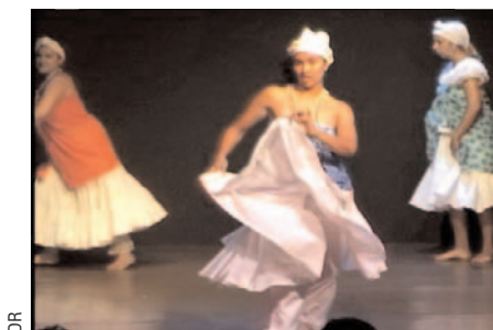
Danse sacrée des Orixas.

Pour les moins aventureux, vous pouvez aussi apprendre la Bossa-Nova, Samba et autres Salsa. NL Quelques adresses pour prendre des cours à Paris: Espace Fontaine: 42 rue Fontaine, 9 e http://www.capoeira-palmars.fr