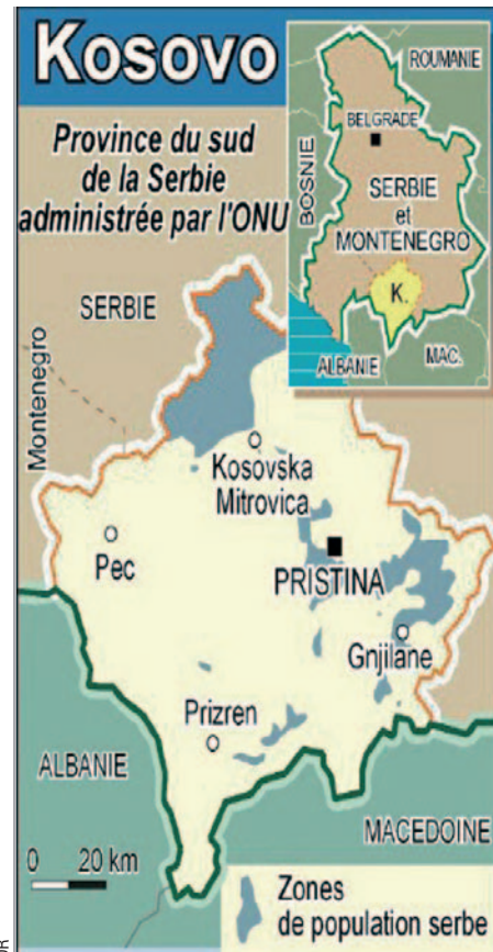
Kosovo, province à 90 % albanaise.

Les discussions, placées sous l'égide de l'ONU, n'avaient pas débuté sous les meilleurs auspices. À leur arrivée au château de Niederösterreich, lundi matin, les deux délégations menées par le président et le premier ministre serbes, messieurs Tadic et Kostunica et leurs homologues kosovars albanophones messieurs Sedjtu et Ceku, avaient refusé de se serrer la main. C'était la première fois que des dirigeants des deux camps se rencontraient officiellement depuis 1999, date à laquelle l'OTAN avait mis fin au conflit opposant séparatistes albanais à l'armée