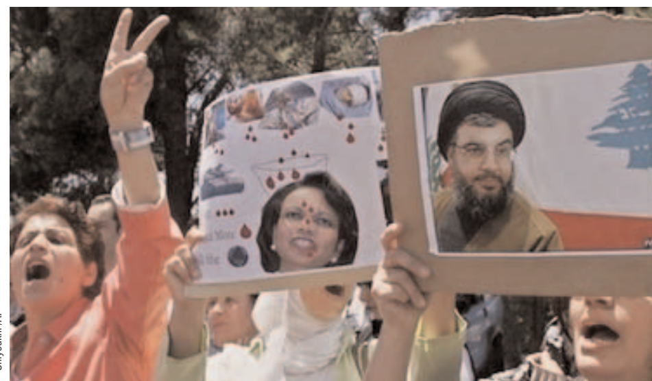
Slogans anti-américains Des manifestants palestiniens, devant le bureau de M. Abbas.

Les grandes puissances peinent à s'engager sur une intervention militaire. P. 3