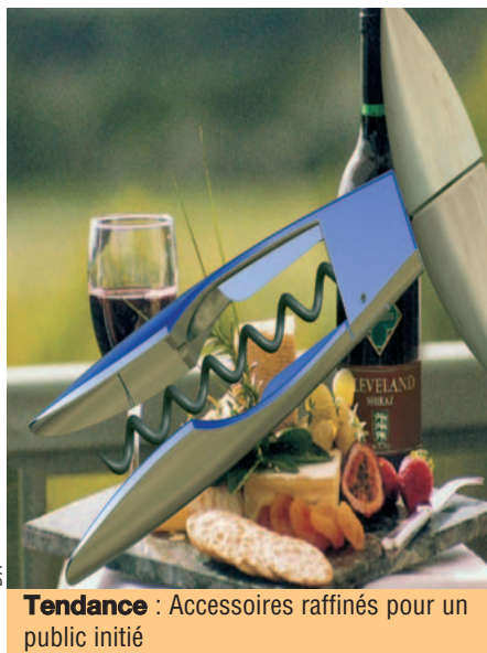
Tendance : Accessoires raffinés pour un public initié

Le regain d'intérêt pour le vin fait le bonheur des écoles de dégustation. Le chiffre d'affaires de l'École des vins augmente de 30 % par an. « Il y a 25 ans, quand j'ai créé mon institut, 80 % de mes clients étaient américains ou japonais. A l'époque les Français avaient l'impression qu'ils